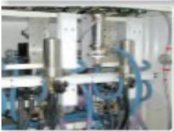
Originalausstattung: Installation von IIS-Viskosimetern.

Das IIS-Viskosimeter wird zwischen Pumpe und Maschine „Druckwerk“ eingesetzt und benötigt KEINERLEI BEWEGLICHE TEILE, um die Viskosität während des gesamten Ablaufs zu überwachen und zu regeln. Die tatsächliche Viskosität wird in Echtzeit detektiert und an der Touchscreenmonitor eines Multikanal-Systems angezeigt. Die Ist- und Sollwerte der Viskosität werden miteinander verglichen und je nach Erfordernis wird ein Regelventil ausgelöst, das zur Erhaltung der korrekten Viskosität einen vorbestimmte Menge Korrekturflüssigkeit (Lösemittel, Wasser oder Aminlösung etc.) einspritzt. Nach jeder Einspritzung erfolgt ein paar Sekunden lang eine Verweilzeit, damit sich die Flüssigkeit gleichmäßig vermischen kann und gleichzeitig zu hohe Korrekturen und Produktverdünnungen vermieden werden. Der Sensor überwacht auch während