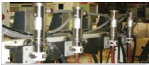
Kunden-Installation als Zubehör an gefährlichem Standort auf vom Abnehmer gefertigten Standen.

Das IIS-Viskosimeter wird zwischen Pumpe und Maschine „Druckwerk“ eingesetzt und benötigt KEINERLEI BEWEGLICHE TEILE, um die Viskosität während des gesamten Ablaufs zu überwachen und zu regeln. Die tatsächliche Viskosität wird in Echtzeit detektiert und an der Touchscreenmonitor eines Multikanal-Systems angezeigt. Die Ist- und Sollwerte der Viskosität werden miteinander verglichen und je nach Erfordernis wird ein Regelventil ausgelöst, das zur Erhaltung der korrekten Viskosität einen vorbestimmte Menge Korrekturflüssigkeit (Lösemittel, Wasser oder Aminlösung etc.) einspritzt. Nach jeder Einspritzung erfolgt ein paar Sekunden lang eine Verweilzeit, damit sich die Flüssigkeit gleichmäßig vermischen kann und gleichzeitig zu hohe Korrekturen und Produktverdünnungen vermieden werden. Der Sensor überwacht auch während